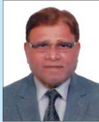
S.A.B.M. Humayun Managing Director