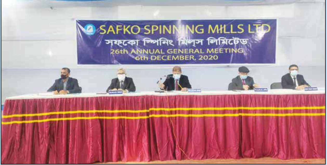
কোম্পানীর ২৬তম বার্ষিক সাধারণ সভায় পরিচালকমন্ডলী