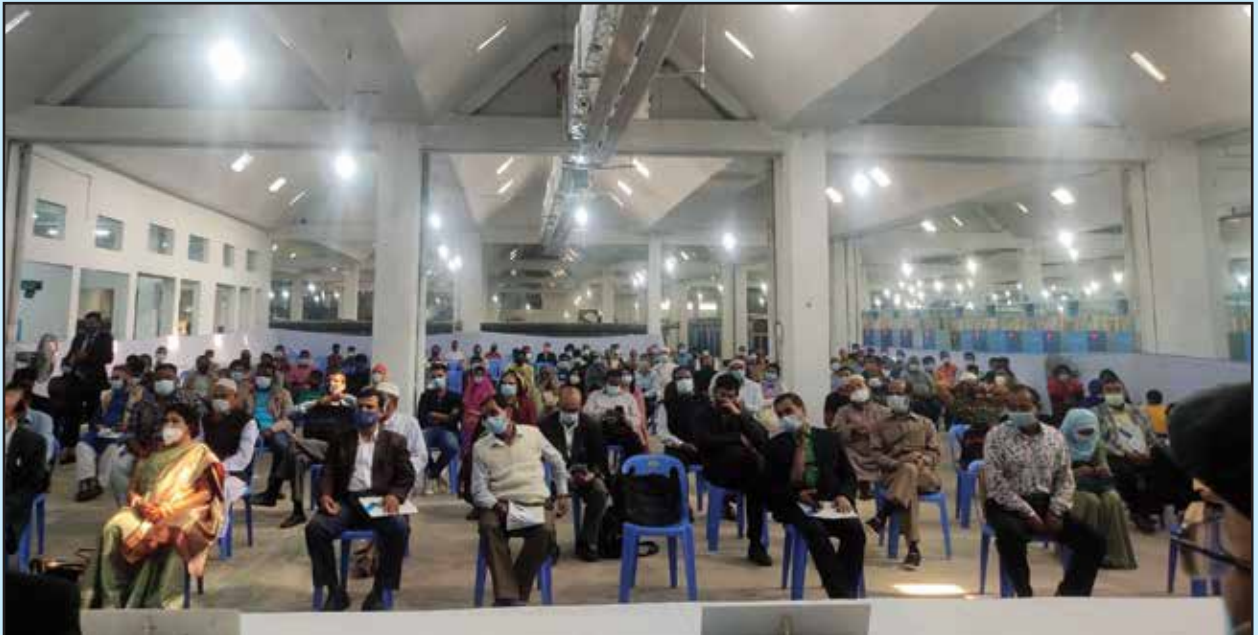
২৬তম বার্ষিক সাধারণ সভায় উপস্থিত শেয়ারহোল্ডারবৃন্দের একাংশ